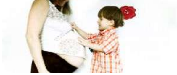
Resim 2.9: Yeni bir kardeş fikri

Yeni bir kardeşin dünyaya gelmesi genellikle kıskançlık başlangıcı olabilir. O güne kadar tüm sevgi ve ilgiyi tek başına yaşarken yeni bir kardeş ona göre sevgiyi parçalamıştır. Yeni doğanın anneye bağımlı oluşu da kıskançlık duygusunu iyice artırır.