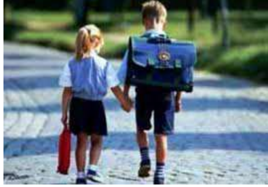
Resim 1.1: Uyumun farklı yaşlara etkisinin önemi