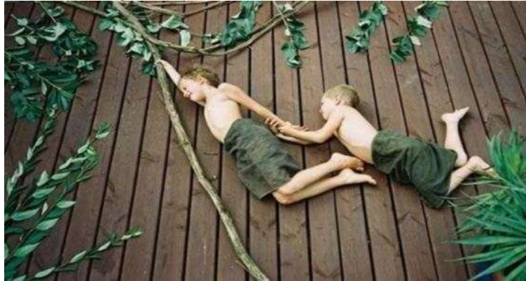
Resim 2.14:Hayali oyunlar

Altı yaşından küçük çocuklar, gerçeğe hayali birbirinden ayırt edemedikleri için bu yaşa kadar söylenen yalanlar davranış bozukluğu olarak düşünülmez. Evde yalnız başına evcilik oynarken boş koltuklarda misafir varmış gibi onlarla konuşan, “Kiminle oynuyorsun” sorusuna “Arkadaşlarım var bak onlarla oynuyorum” diyen dört yaşındaki bir çocuk hayali oyunlar oynar ve hayali yalanlar söyler. Bu, onun gelişimsel özelliğidir. Okul öncesi dönemde henüz hayal ve gerçeği birbirinden ayıracak olgunluğa ulaşmadıkları için çocuğun her söylediği yalan olarak değerlendirilmemelidir.