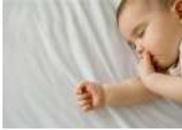
Resim 2.12: 0-1 Yaş ağızdan zevk alma dönemi

Çocuklar kendi sorunları ile başa çıkmada yetişkinler kadar güçlü değildir. Korku, açlık, anneden ayrılma ya da uykuya dalma sırasında parmak emme, dudakları ile oynama veya dudak ısırma, koparma davranışları gösterebilirler. Örneğin; kreşe başlamış on bir aylık bir bebek anneden ayrı kalmanın verdiği korku ve endişe ile parmak emme davranışını sıklaştırabilir. İleriki yaşlarda parmak emme davranışı, boşanmalar, anne-babadan birinin ölümü, babanın ya da annenin uzun süre evden uzakta kalışı, kaygı, kıskançlık gibi nedenlerden kaynaklanabilir.